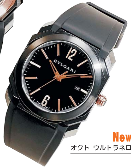
New オクト ウルトラネロ