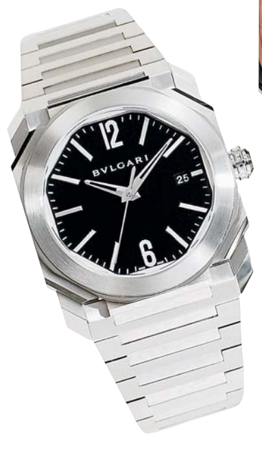
オクト ソロテンポ

デザインはローマ建築に多く用いられる八角形をモチーフとし、手作業で110面カットされたケースが採用されている。そしてブルガリの熟練した時計職人によって、完全自社開発製造のムーブメントが組み込まれ完成される。毎年新しいコレクションが展開され、バリエーションがますます充実している。