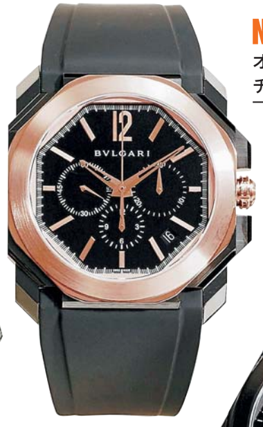
New オクト ウルトラネロ ヴェロ チッシモ