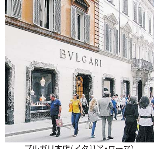
ブルガリ本店(イタリア・ローマ)