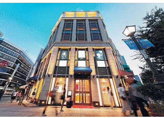
カミネ トアロード本店