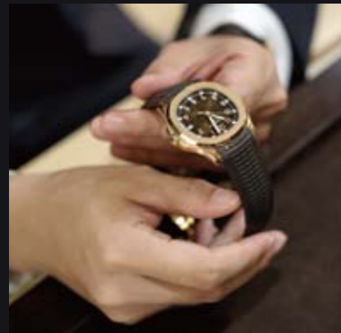
アクアノート 5167 ケース:RG、ケース径:40mm(10-4時方向)、 自動巻き、399万円(税別)

「新たに腕時計を買うなら次もまたパテック フィリップ」というY.N氏とM.T氏。 2人にそこまで惚れ込むポイントを伺った。